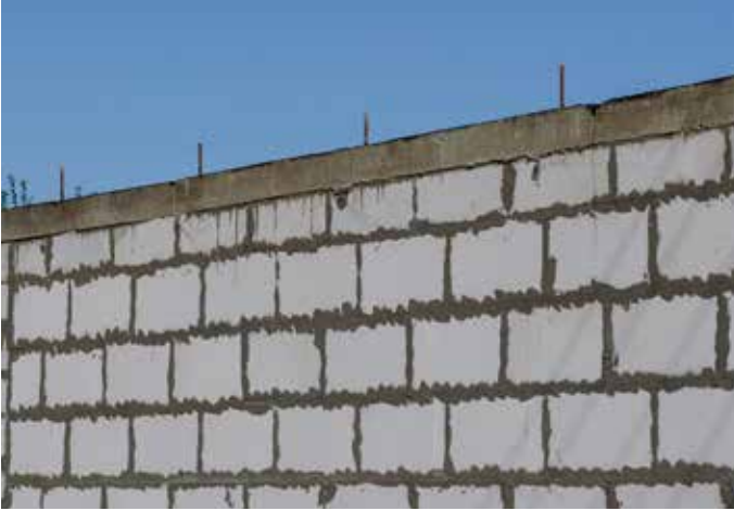
Ürün Kodu: 11425